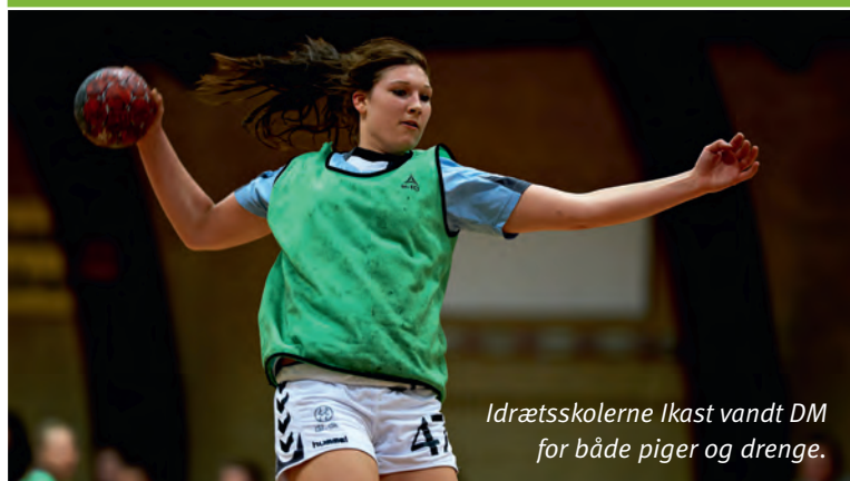
Idrætsskolerne Ikast vandt DM for både piger og drenge.