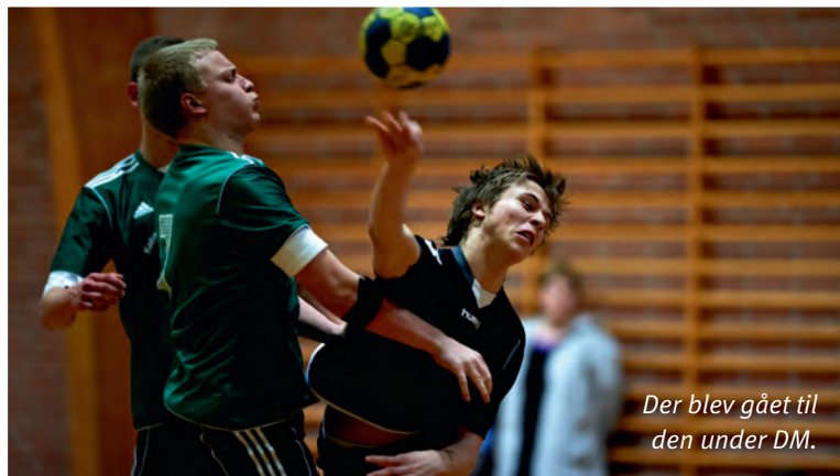
Der blev gået til den under DM.