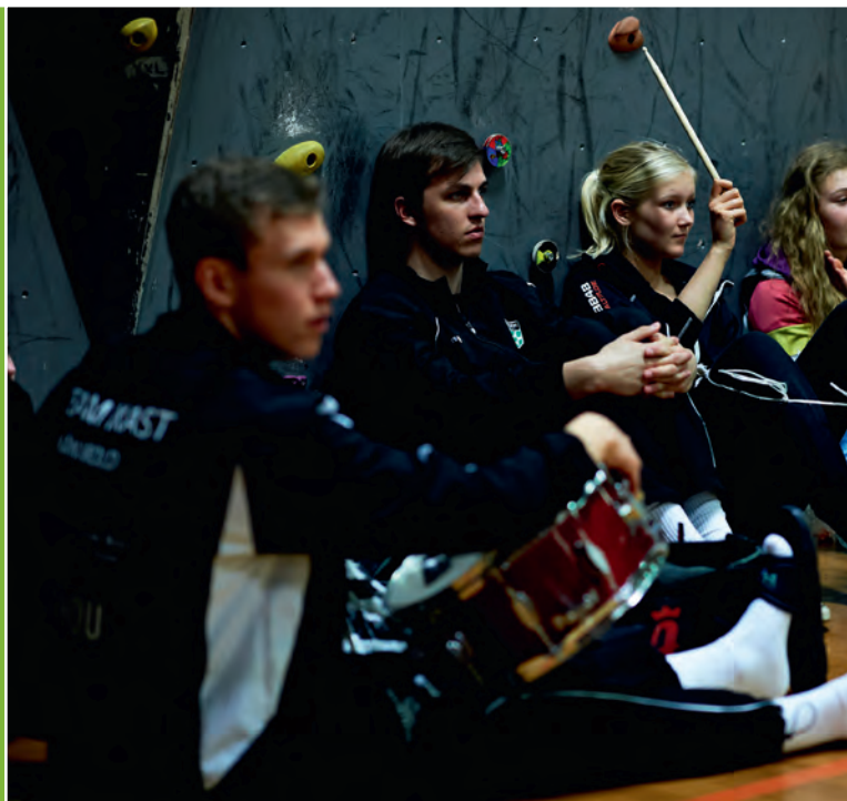
Opbakningen fra kammeraterne fejler traditionen tro intet ved et efterskolestævne.