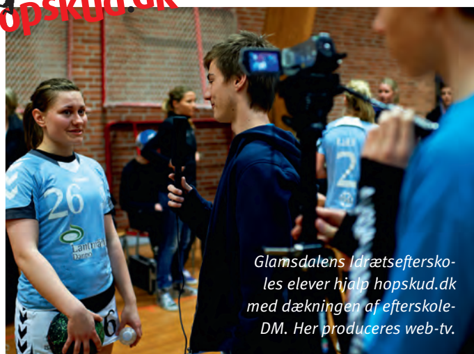
Glamsdalens Idrætsefterskoles elever hjalp hopskud.dk med dækningen af efterskole-DM. Her produceres web-tv.